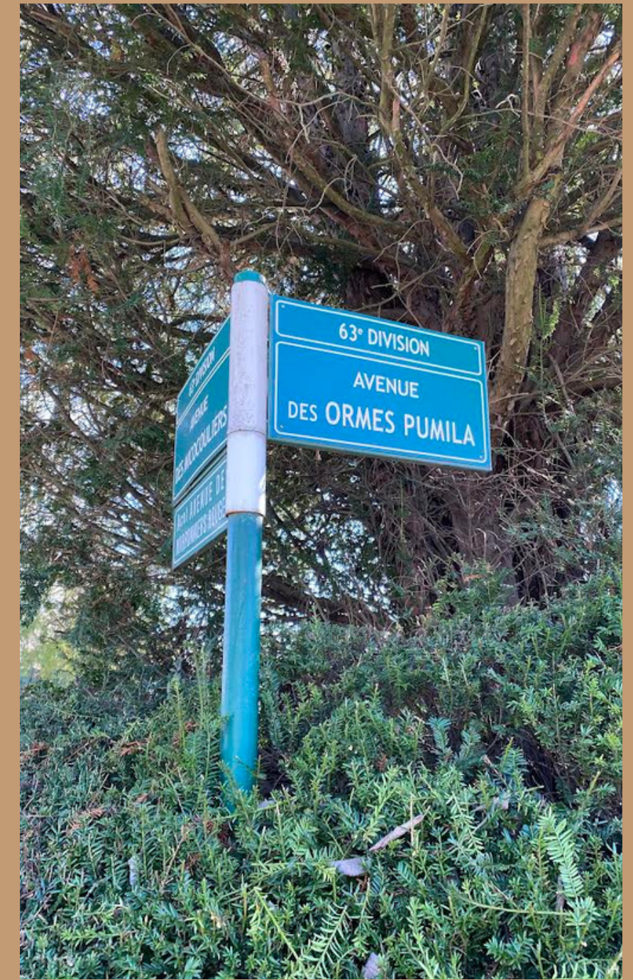
Tombe située avenue des Ormes Pumila Cimetiere de Bagneux